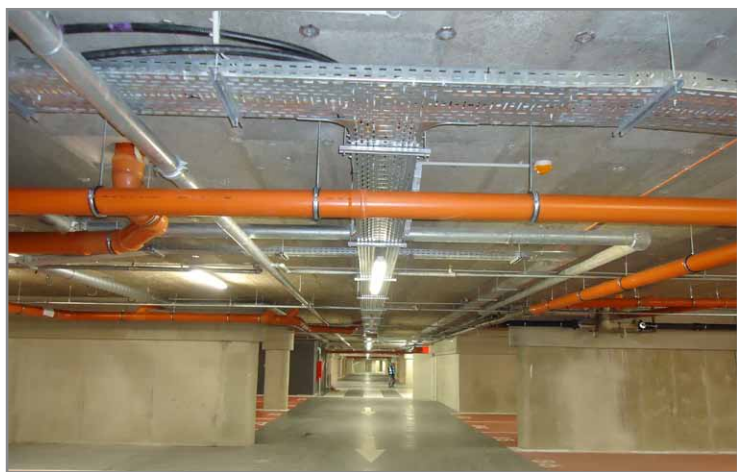
Nobasil ADN 120mm + Heraklith A2 CF 25mm élképezve, fehér (vagy kívánt) színre festve

E havi hírlevelünkben is ilyen tulajdonságú hőszigetelő anyagokkal készült referenciát mutatunk be, egy fűtés nélküli mélygarázs mennyezetét, azaz egy alulról hűlő födém hőszigetelését.