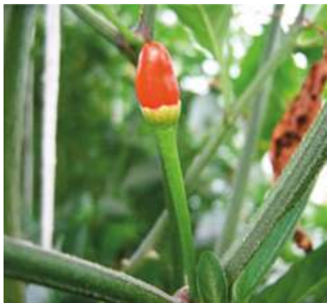
Jamaikai vad paprika

A Syngenta szabadalmaztatott növényei most részben ellenállnak az üvegházi molytetveknek és/vagy a tripszeknek. Mindenesetre az engedélyezési folyamat során a Syngentának ki kellett vennie szabadalmi kérelméből a tripszrezisztenciát, mivel a szakirodalomban 15 azt már leírták. Ezért az újszerűség nem állt fenn és a szabadalmat nem lehetett bejegyezni.