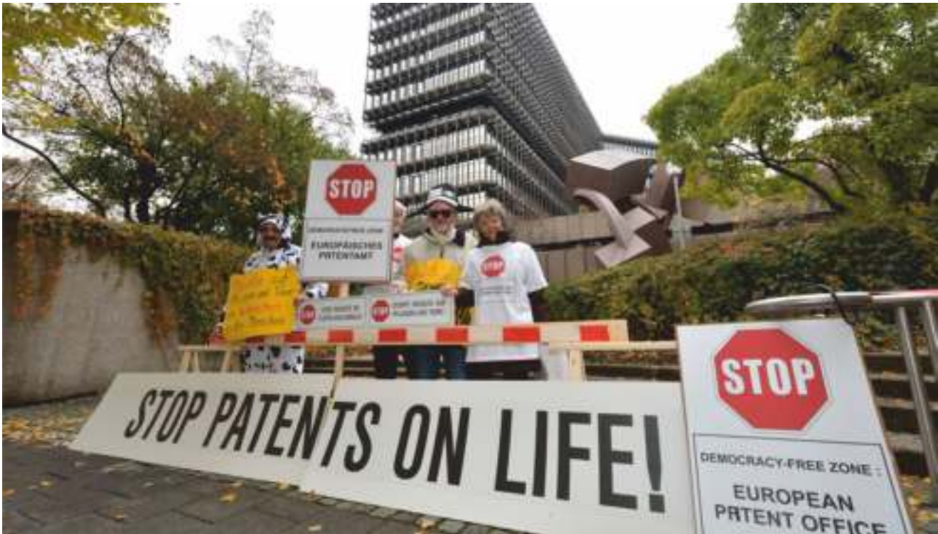
no patents on seed