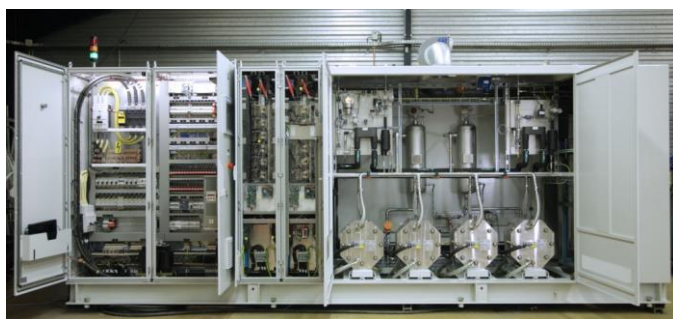
Konténeres felépítményű elektrolizáló.

A cég elektrolizáló termékcsaládja hét tagból áll: E5, E10, E20, E30, E40, E60, E120, amelyekben a szám a termelt hidrogén Nm 3 /óra egységben kifejezett értéke, azaz 5-től 120 Nm 3 /h hidrogén kapacitású elektrolizáló léteznek. E hidrogéntermelés megfelel 40 – 960 kW input villamos energia teljesítménynek. A kisebb teljesítményű (E5 – E20) elektrolizáló 1,8 x 1,9 x 2,2 m méretű konténerben vannak elhelyezve; nagyobb teljesítményűek (E30-E120) mérete pedig 2,4 x 1,9 x 2,2 m.