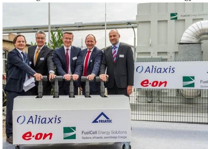
Az MCFC kiserőmű ünnepélyes átadási ceremóniája.

Karsten Wildberg, az E.ON igazgató tanácsának tagja az átadón elmondta: „a tüzelőanyag-cellás technológia egyik kulcsterülete a jövő tiszta energia technológiáinak. Ezen erőmű üzembe állítása egy