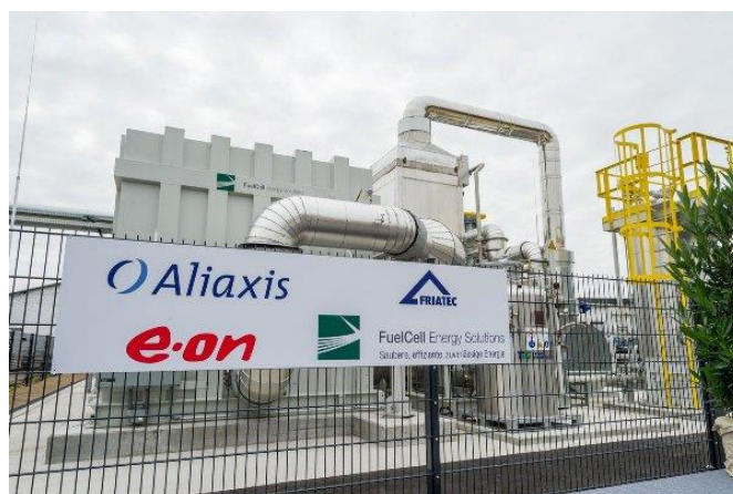
A működő MCFC kiserőmű a FRIATEC telephelyén.