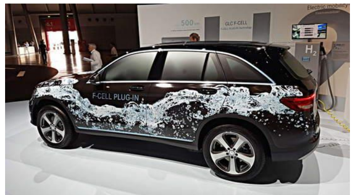
Mercedes GLC F-Cell.

A sajtóközlemények szerint a Mercedes GLC F-Cell teljes hatótávja 500 km lesz, a tisztán akkumulátorhasználattal megtehető távolság körülbelül 50 km. A tüzelőanyag-cellás GLC-be két,