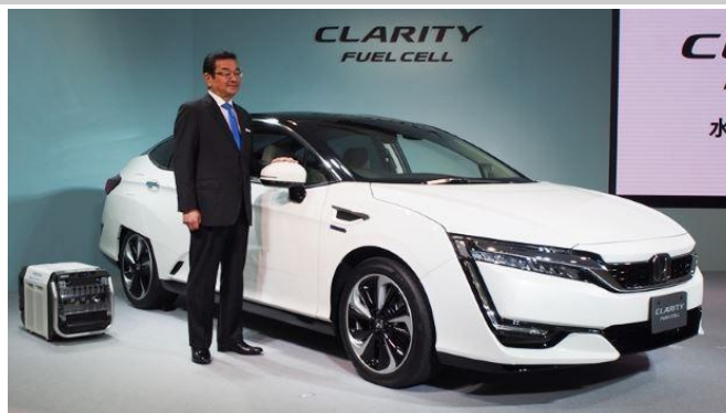
Honda Clarity Fuel Cell egy bemutatón.

Természetesen a HTC modellek esetében is előfordul, hogy különböző források (az eltérő vezetési ciklusokon alapulva) jelentősen eltérő hatótávot adnak meg. E jelenség egyelőre a tisztán akkumulátoros (BEV) járművek esetén is tapasztalható. Más források [1], [2] a Honda Clarity Fuel Cell-re 750 km hatótávot adnak meg. A US EPA adata tehát inkább egy mértéktartóbb, valószínűleg szigorúbb vezetési ciklust alkalmazva hitelesítette a jármű hatótávját. (Az ismert NEDC-ciklust [Új Európai Mérési Ciklust] a szakirodalom kifejezetten „megengedőnek”, azaz kevésbé szigorúnak tartja.)