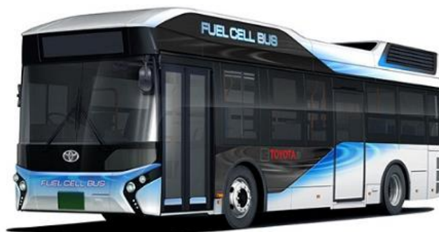
Toyota HFC busz.

Ahogy más japán gyártmányú HTC járművek, a Toyota FC Bus esetében is szempont volt, hogy vészhelyzeti áramforrásként tudjon működni. Esetleges természeti katasztrófák során bekövetkező áramkimaradás esetén a busz 9 kW maximális