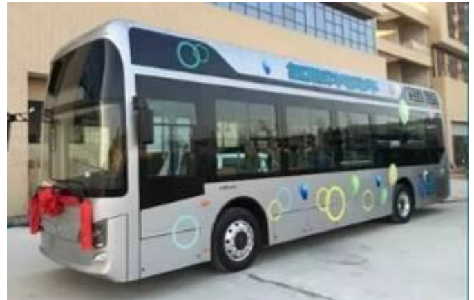
A 12 most átadott HTC busz egyike. Kép: Ballard.

A HTC busz programban a Ballardnak számos kínai projekt partnere volt illetve van, így például: