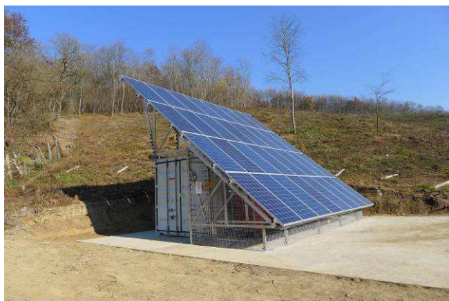
Az energiakonténer teljes felépítménye a Gemencben.

A berendezés áramtermelő egysége egy 10 kW p névleges teljesítményű fotovoltaikus rendszer, ami 870 Ah/48V méretű AGM akkumulátorállomáshoz csatlakozik. Az akkumulátorok töltését két töltés-