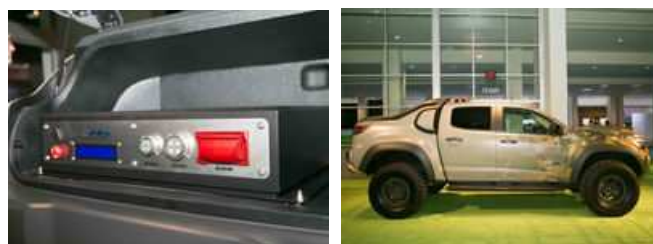
A katonai tesztelés alatt álló Chevrolet Colorado ZH 2