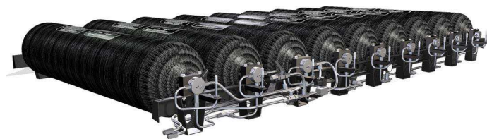
Hidrogén tartályrendszer.

alumínium és kompozit gázpalack gyártója, amelynek kizárólagos kelet-európai képviselője a magyar Rév és Társai Gázipari Kereskedelmi Kft.