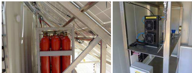
Hidrogén palackok kívül, a napelemek alatt (b), és a tüzelőanyag-cella a konténerben (j).

Amikor addicionális áramra van szükség, egy tüzelőanyag-cella a hidrogént ismét árammá alakítja. A folyamat során némi vízgőz és hő keletkezik. A hőtermelés ez esetben nem veszteség, mivel a gázos szekció működéséhez minimum 5°C hőmérsékletre van szükség, és a cella döntően a hidegebb, téli időszakokban üzemel. A termelt hő tehát kiváltja a rendszer önfogyasztásának egy részét. A rendszer először 500 W teljesítményű üzemanyag-cellával üzemelt, mivel a több éven át végzett mérések azt mutatták, hogy 4 – 5 egymást követő felhős, „sötét” napot ezzel a teljesítménnyel lehet áthidalni. A tapasztalatok igazolták, hogy igen kis valószínűséggel fordul elő olyan időszak, amikor a rendszer ennél hosszabb ideig nem képes elegendő áramot termelni, és az akkumulátorokban sincs több tartalék. A tesztidőszak során kiderült, hogy a külső hőmérsékletre, mint teljesítményt befolyásoló tényezőre, nagyobb figyelmet kell fordítani. Amikor a nagyon hideg időjárás és a sötét napok egybeesnek, a rendszer önfogyasztása – a gázos szekció fűtési igényének növekedése miatt – megnő, és ezt az 500W teljesítményű üzemanyagcella már nem képes ellensúlyozni. Nagyobb teljesítményű cellára van tehát szükség, ezért üzembe állítottak egy 1,2 kW