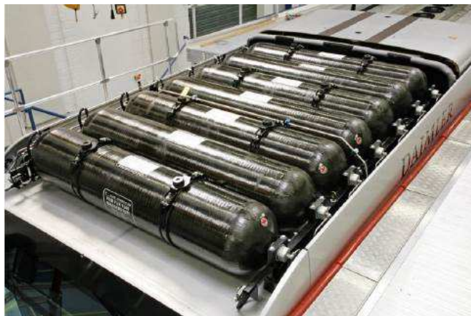
Hidrogén tartályrendszer beépítve egy HTC busz tetjén: összesen ~43 kg hidrogén tárolására alkalmas (350 bar)

A Luxfer H 2 palackjai ún. T3-as típusúak, ami azt jelenti, hogy könnyített alumínium béléstesttel ellátottak és teljes felületükön szénszállal tekercseltek. Ez a konstrukció a hegesztésmentes béléstest és az epoxy gyantába ágyazott szénszálltekercselés tökéletes illeszkedésének köszönhetően egyidejűleg biztosítja a palackok könnyű súlyát, a 100%-os szivárgásmentességet és korrózióállóságot. Esetleges tűz esetén a béléstest nem olvad meg, így a kontrolálatlan robbanás teljesen kizárt. Gyorstöltés esetén a béléstest túlmelegedése nem fordulhat elő az alumínium liner hőelosztásának köszönhetően, ugyanakkor 100%-os töltöttség elérésére van lehetőség. Minden egyes rendszer a Luxfer által kifejlesztett és szabadalmaztatott BV350 biztonsági eszközzel