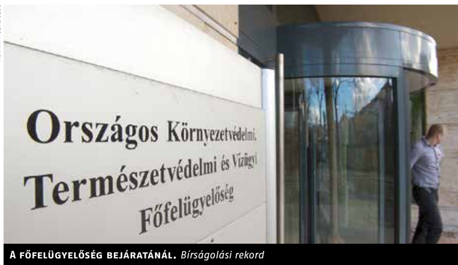
A FŐFELÜGYELŐSÉG BEJÁRATÁNÁL. Bírságotlasi rekord